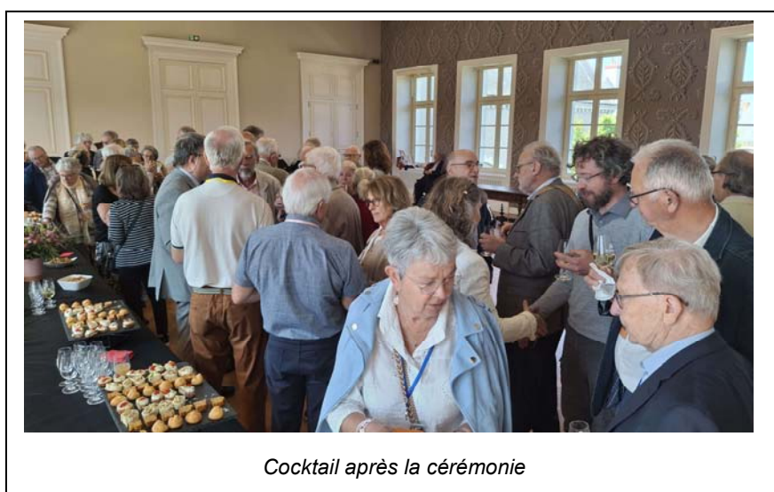
Cocktail après la cérémonie