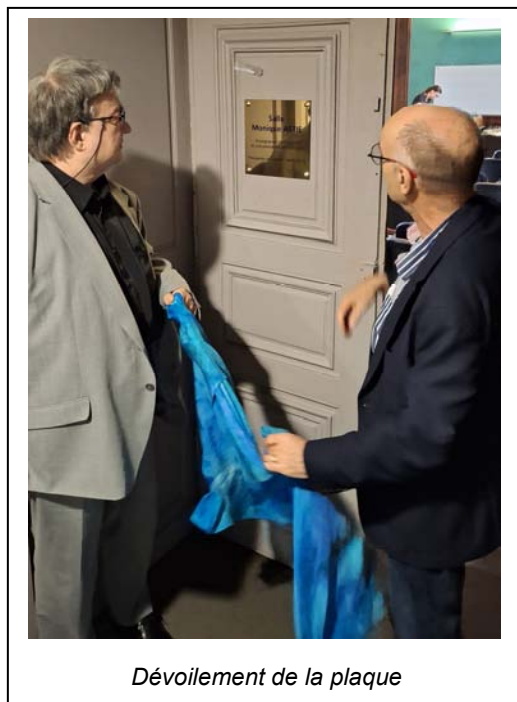
Dévoilement de la plaque